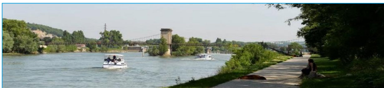
« Rives de Saône » : permettre au Grand Lyon de réintégrer pleinement nature et biodiversité dans la ville

Biotope sera également heureux de vous accueillir Hall 1 – Allée G – Stand 45 afin de vous présenter leurs savoir-faire et dernières actualités.